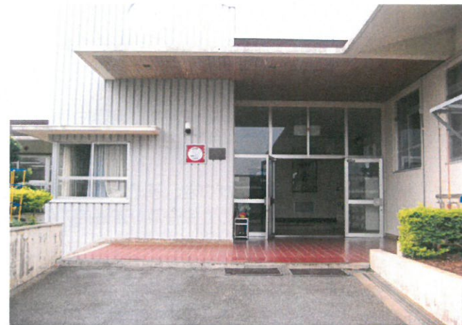
地域小規模児童養護施設 つきかげ・ともいき