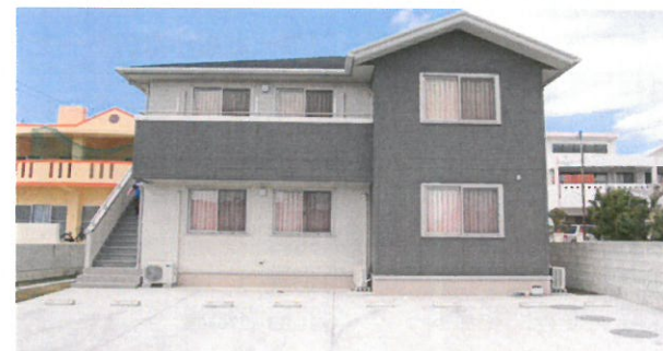
グループホーム さらな