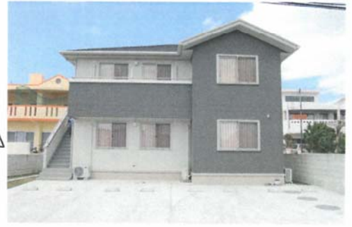
地域小規模児童養護施設 つきかげ