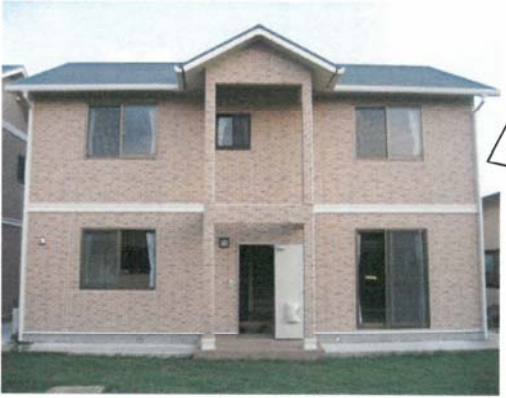
グループホーム さらな