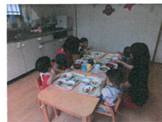
かるなの食事風景